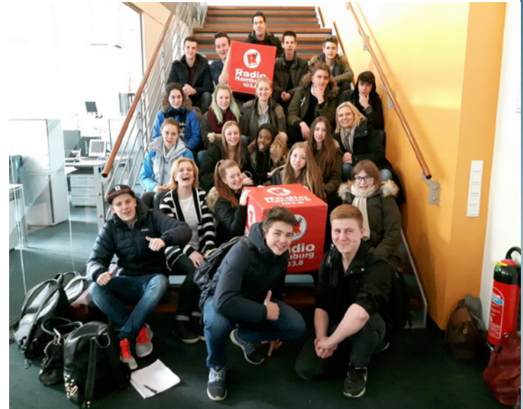
Medienprofil bei Radio Hamburg