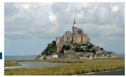
Le Mont-Saint-Michel, Normandie, Frankreich (2)