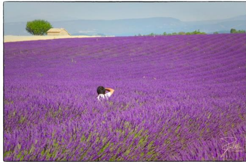
Provence, Frankreich (3)