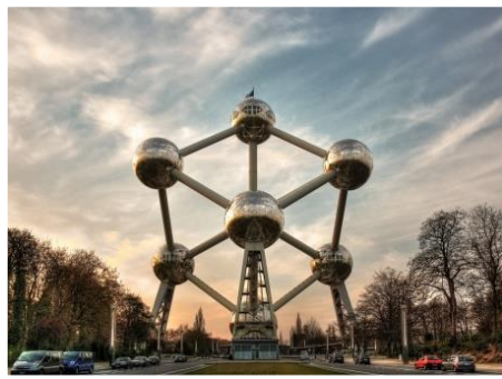
Brüssel, Belgien (1)