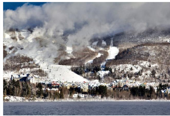
Montreal, Quebec, Kanada (7)