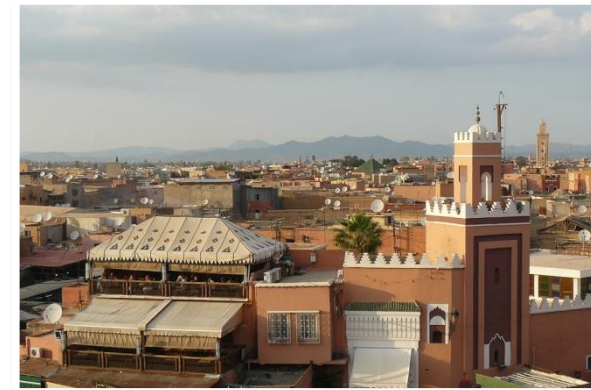
Marrakech, Marokko (5)